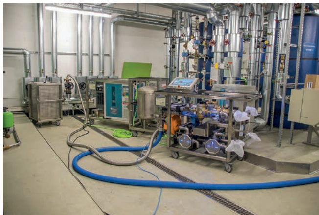
Systemspülanlage im Einsatz